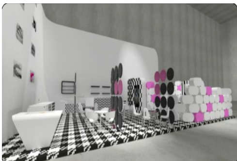
FUTURBAR 2015 Milano