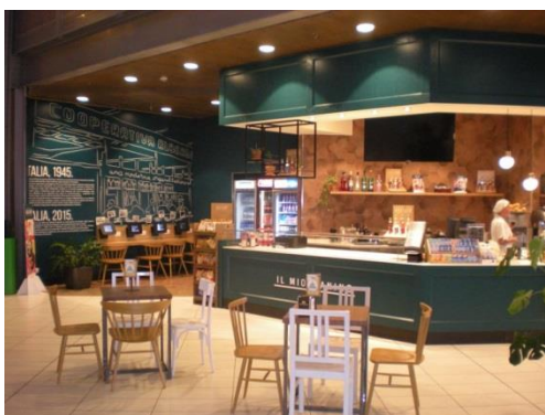
FUTURBARGREEN 2017 Milano